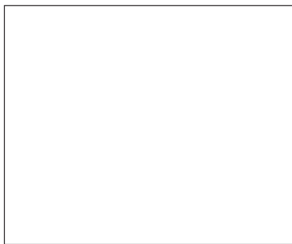
1965 - La consegna del Ponte d'Oro a Fedele Frigerio (a destra)