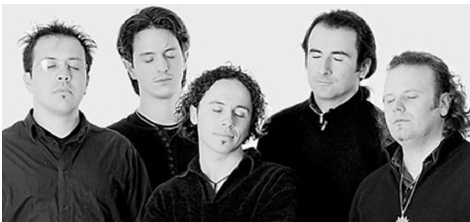
Gli Yo Yo Mundi