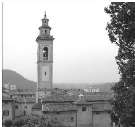
Uno scorcio del centro storico di Balerna

Al di là di queste sottigliezze terminologiche (ma nomina sunt consequentia rerum!), la giornata vissuta dalle nostre classi 3° B e 3° E a Balerna è stata molto positiva e coinvolgente: abbiamo potuto sperimentare la proverbiale precisione svizzera (tutto era perfet-