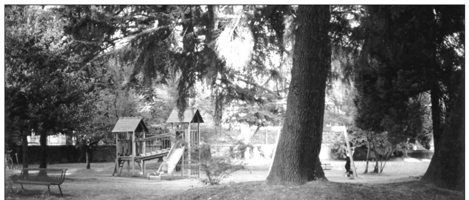
Il parco di Villa Braghenti

Per la vostra pubblicità su Malnate Ponte rivolgetevi all'Ufficio cultura del Comune telefono 0332 275 282